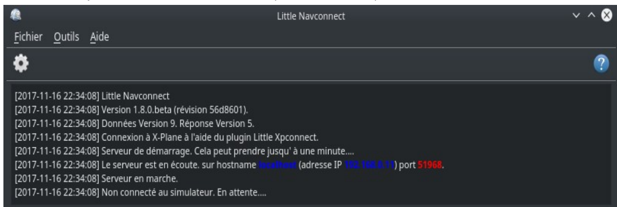
Photo ci-dessus: Little Navconnect est en marche et attend un simulateur de vol. Les boutons FSX ou Prepar3D et X-Plane ne sont pas affichés sur MacOS et Linux ou si SimConnect n'est pas disponible.

Vous devez essayer toutes les adresses si vous n'êtes pas sûr de savoir laquelle utiliser.